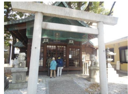
金山神社のイチョウ（名古屋市保存樹）金山新橋交差点・美濃路と佐屋路の分岐点、陸橋を渡る。