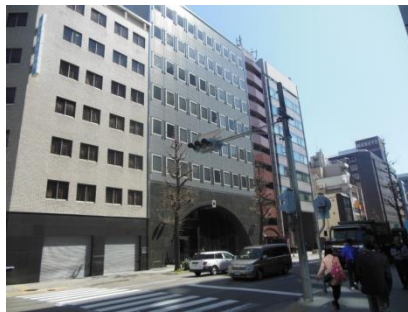
やっとゴールの伝馬町通り本町に到着、札の辻の案内板 ここが尾張藩の広報の場、街の中心