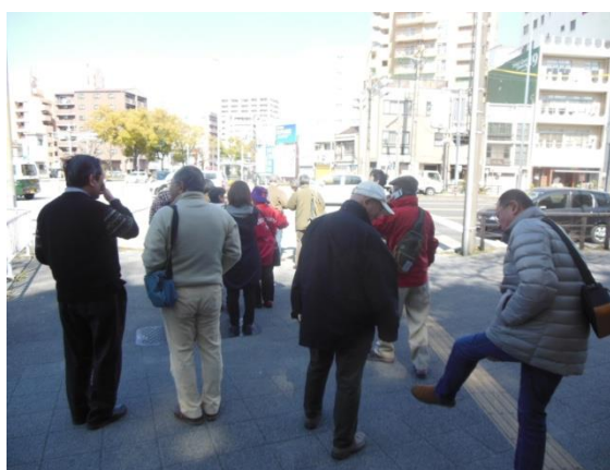
想念寺(名古屋プラザクラブが想念寺と共同で老人施設訪問をしていた)・料亭賀城園