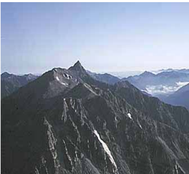
年内には槍ヶ岳か？