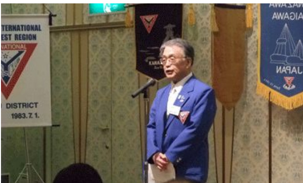
鈴木西日本区理事のご挨拶

『障害者雇用は、健常者の従業員の意識も変えました。初めのうちは面倒を見ようという気持ちが強かったのですが、障害者の熱心な働きぶりや