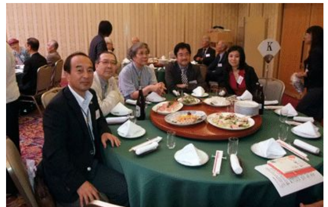
グランパスチームのテーブルにて