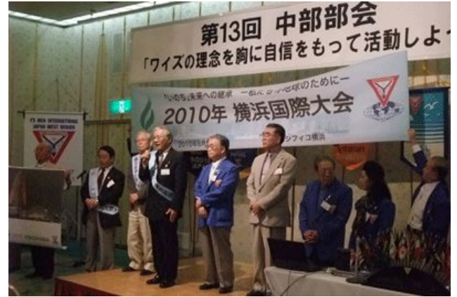
横浜国際大会のアピール

成長を見るにつれ、自分たちもしっかりとやろうという気持ちになっていきました。何より私自身が彼らに出会ったことでさまざまなことを学びました。』という言葉は、我々ワイズメンの奉仕活動の基本と同じだと思いました。