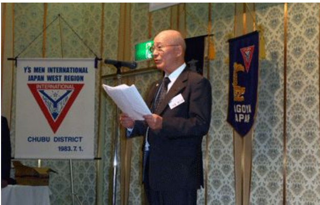
大島中部部長のご挨拶

重度・軽度知的しょうがい者を雇用し、会社もチョコレート業界のトップ企業へ導く経営のお話があり、しょうがい者一人一人の感性特性を取り入れた地道な会社・工場改革は大変感銘を受けました。