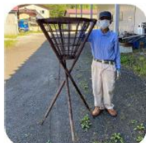
当時のかがり火台に点火します

■お問合せ 名古屋 YMCA 遠藤 アドレス e-endo@nagoyaymca.org