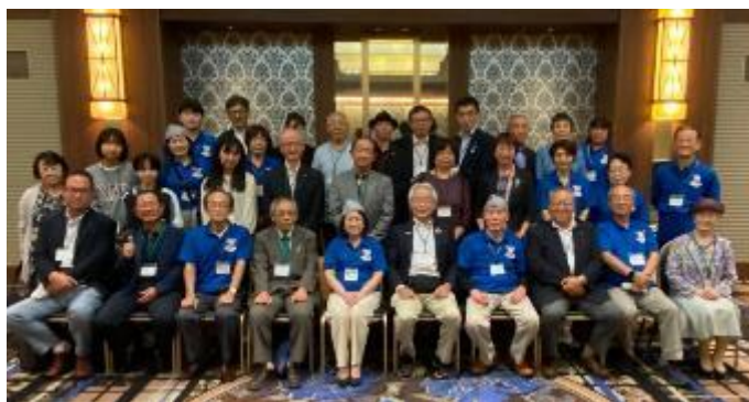
前夜祭ご参加の面々

久々の金沢訪問は9月23日の前夜祭でした。30数名の参加者で美味しいものを食べて呑んで、对面再会を楽しみました。特にプログラムは計画されておらず、オフレコで何言ってもOKでそれぞれが壇上で今まで聞いたことのない話を披露し合い楽しいひと時を過ごしました。