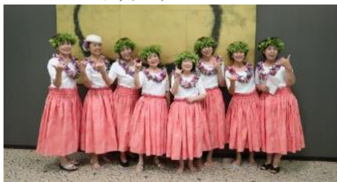
フラワイズアマチーム