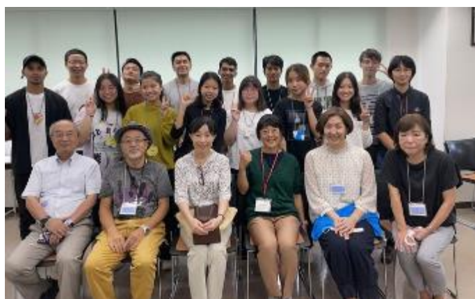
最前列が清水先生とチューターの皆さん