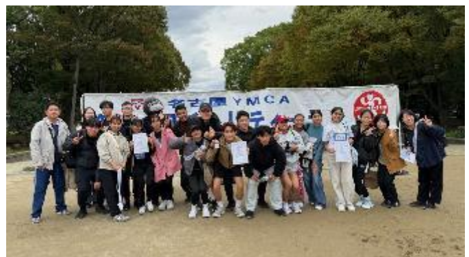
グランパスサポートの日本語学院チーム

場所は少し泥濘んではいましたが、幼稚園児から大人迄ギャラリーの応援にこたえて走り抜けていました。名古屋地区のウィズのメンバーも色々とお手伝いに忙しく働き、汗をかきました。多くの寄付も頂き今年度も無事に終了しました。協力を頂いた皆様に感謝致します。YMCA のスタッフ並びにリーダーにはご苦労様でした。