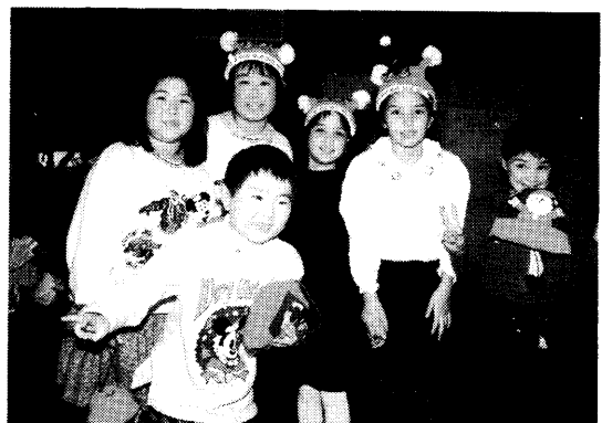
楽しそうな顔・顔・顔 来年も又来てネ!