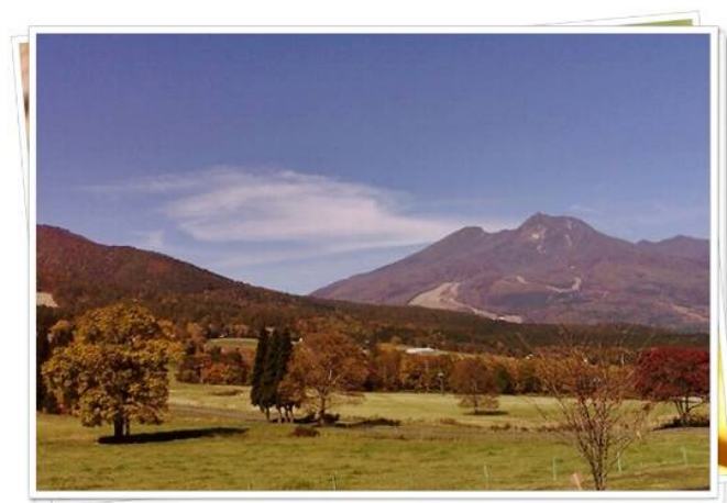
黒姫高原と妙高のパノラマ

「森のトットコ」がはじめてノルディックウォーキングを知ったのは、大手術を受けた2009年の秋でした。職場は年中無休・交替勤務制でしたので休日がやってくる周期や毎日の勤務時間が一定ではなくどうしても不規則な生活になりがちでした。「これからの人生を考えたとき、今こうしてはいられない……。まず生きる原点に戻って体を鍛えなおし、自分自身で生活のリズムを創らなくては……。」と思い、その年の10月「医者」のいる森信濃町森林セラピー基地へ電車に飛び乗ってひとりふらっと出かけてゆきました。抜けるような空の下に見える妙高黒姫高原、爽やかな風になびく木々、光輝くだれもない静寂なパノラマ空間との出会い。こんな空間と時間、こんな世界を持つことができる、ただ美しいと感嘆する心を持つことができる自分(生命)が幸せでした。幸運にも「森の力」(岩波新書)に登場する信濃町役場の方々や、森林メディアトレーナー・地元のリーダーの方々にも面会することができました。その時「ノルディックウォーキングをやってみたら?」とご紹介していただくことがなかったら、私が今こんなにノルディックウォーキングを愛し、身近な自然に囲まれてみるみる回復してゆくことができた「幸せ」や、この活動を通していろんな人たちと出会える喜びを感じることもなかったと思います。」