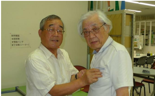
バッジ交換 会長引き継ぎ

事業報告の中で今期特にメネット事業の一つで「アール・ブリュット名古屋展」に津クラブから5点の作品を出品できたこと 施設でのクリスマス会の支援ができたことがあげられます。