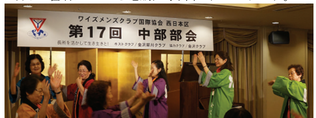
(懇親会で「いいね金沢」の踊りをリードするメネットたち)

今回、何も分からないまま中部メネット会(メネットアワー)に初めて参加させていただきました。初めは緊張しておりましたが、皆様が生き生きと笑顔で楽しそうに協力して働かれておられるのを見て、すぐに打ち解けることができました。今後のメネット会のご活躍を祈りつつ、メネットの皆様にご心から感謝し、御礼申し上げます。