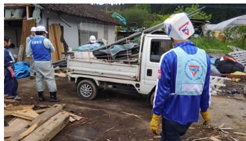
<九州地区学生YMCAのメンバーと作業>