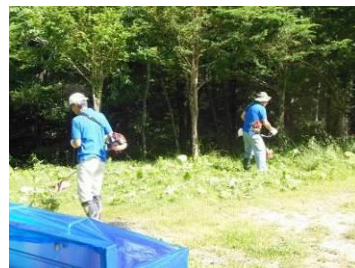
1日目、到着すぐに草刈りに取り掛かる。メインロッジ前の広場は下枝の剪定を終えすっきり。