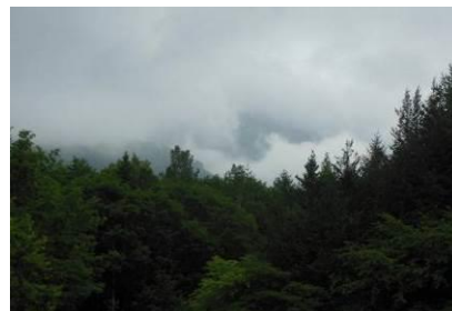
メインロッジ前のイチイ（岐阜県の木）とロッジ前のシンボルツリー。2日目は曇りのち雨。雨の中、草刈り続行、室内の清掃、テントの防水措置など頑張りました。御岳も雲の中。