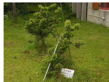
東海クラブが植樹した山桜の生き残り、12年前に植樹したツゲも（あまり大きくなっていないが）。