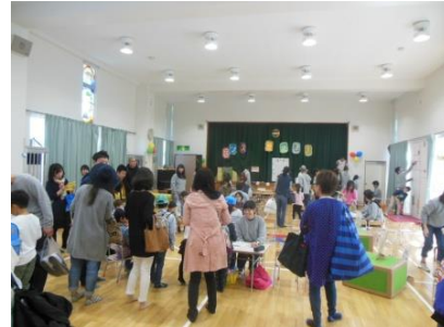
国際協力の案内や手作りの工作コーナー（南山工房）