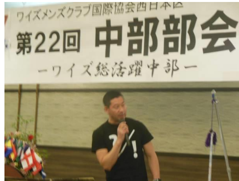
アジア太平洋地域大会（仙台） 御殿場クラブ とやまクラブ設立総会・チャーターナイト