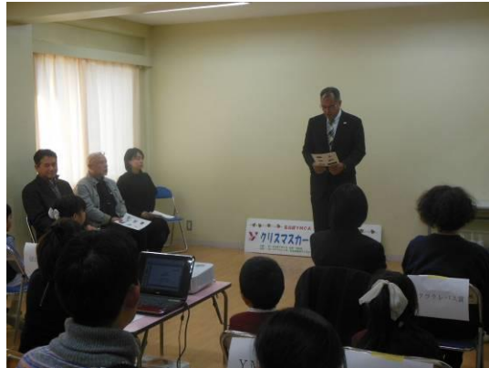
審査の先生の紹介と挨拶