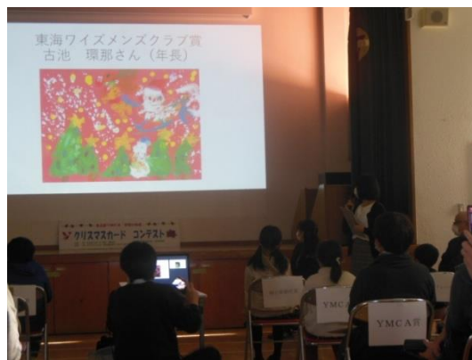
作品の中から今年のクリスマスカードを作成しました。