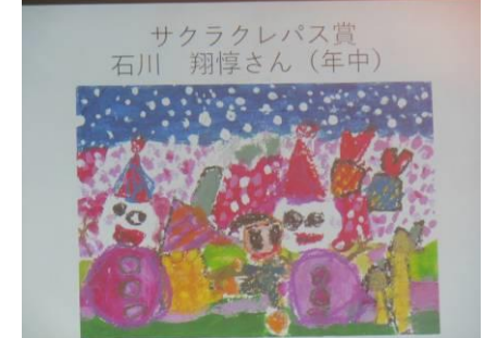
サクラクレパス賞