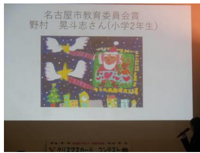
名古屋市教育委員会賞