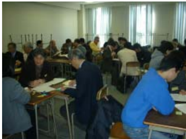
ワークショップ「開発教育」の一場面

Y-Yフォーラムは、YMCAとワイズの協働を考え話し合う為の催しですが、今回は特に『若い世代と一緒に何が出来るか』ということに取り組んでみました。