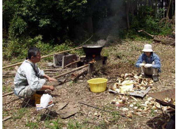
農村の一場面ではありません。アク抜きです。

5月4日(日)毎年恒例の竹の子狩プログラムが三井竹林上にて開催されました。なぜかこの日は天気がよく、これまで一度も雨に降られたことがありません。グランパスメンバーは日頃からオコナイが良いのでしょうか。とれたて新鮮な竹の子料理と各メネット自慢の手料理で満足でした。