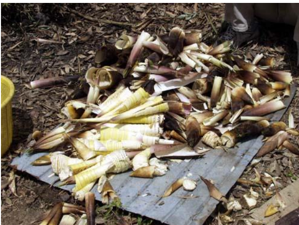
今年も大収穫の竹の子でした。

5月4日(日)毎年恒例の竹の子狩プログラムが三井竹林上にて開催されました。なぜかこの日は天気がよく、これまで一度も雨に降られたことがありません。グランパスメンバーは日頃からオコナイが良いのでしょうか。とれたて新鮮な竹の子料理と各メネット自慢の手料理で満足でした。