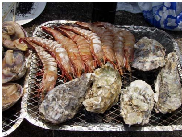
豪華海の幸メニュー(全部食べました)