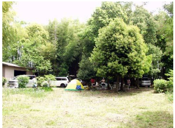
キャンプ場ではありません。三井竹林場です。