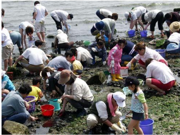
まさにイモを洗うような光景。

4月29日(祝)南知多にて潮干狩りプログラムが開催されました。当日は風もなく絶好の潮干狩り日和。水はまだまだ冷たかったけど、なんのその。メンバー各位はただひたすら貝取りに励んでいました。結果もちろん大漁でした。