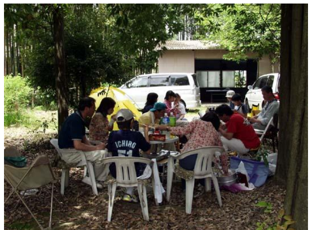
今年も十分いただきました。腹いっぱい!