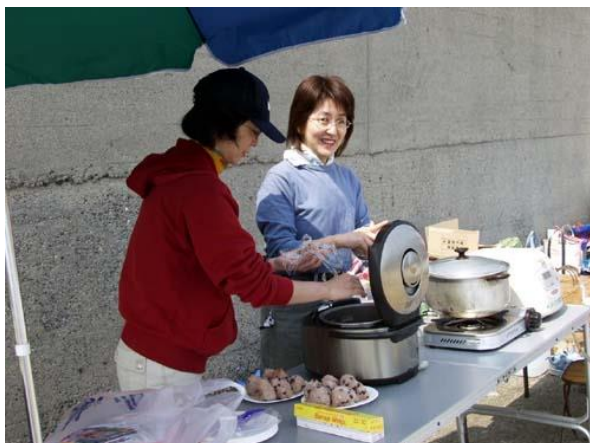
おこわおにぎり旨かったです。