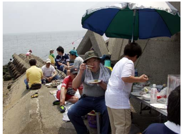
食べるだけの人もいました。