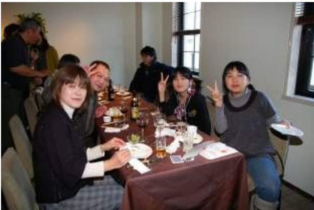
新年はお世話になります