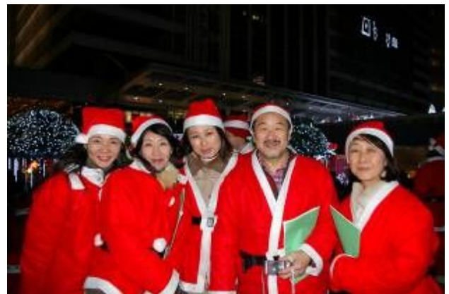
中核をなしたグランパスメンバー