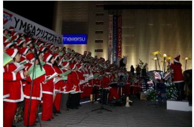
過去最大の聖歌隊でした

キャロル参加者は190余名となり、またたくさんの方に見て・聴いて・歌っていただきました。寒いけど心地よいひと時となりました。準備から当日の運営まで係わっていただいた多くのYMCA関係者に感謝です。