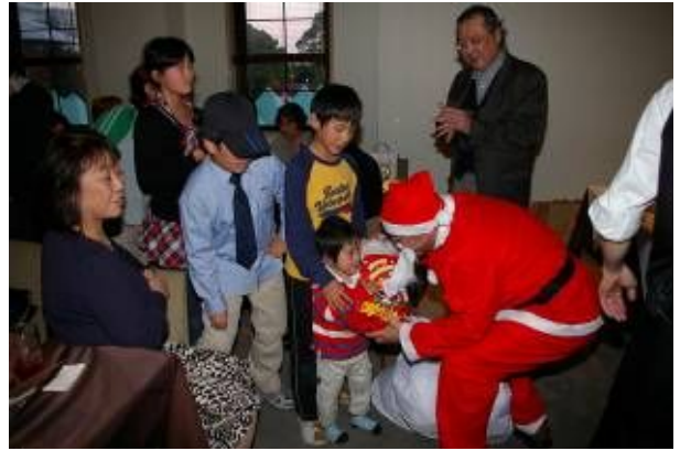
今年のサンタは誰？