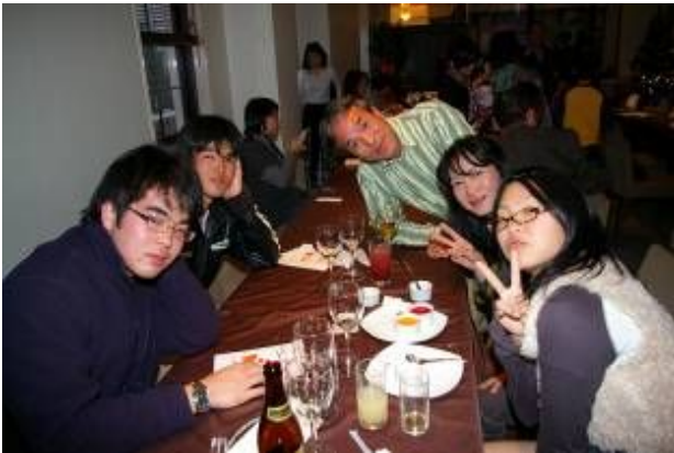
みんな大きくなって巣立ちも近いね