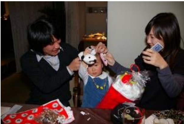
もうすぐマゴ2になります