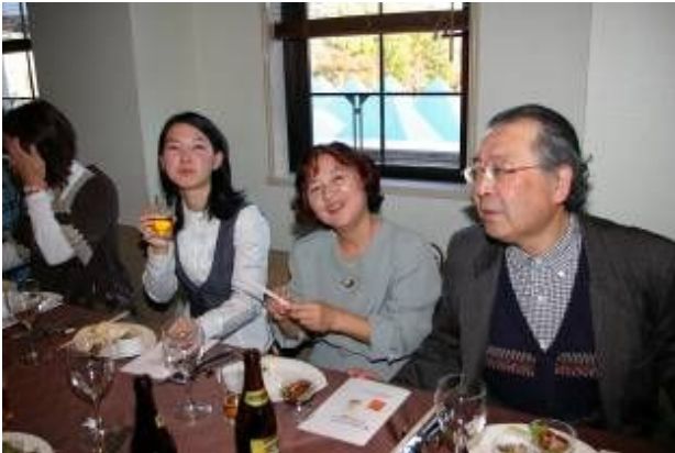
家族の絆最強のワイズの鑑