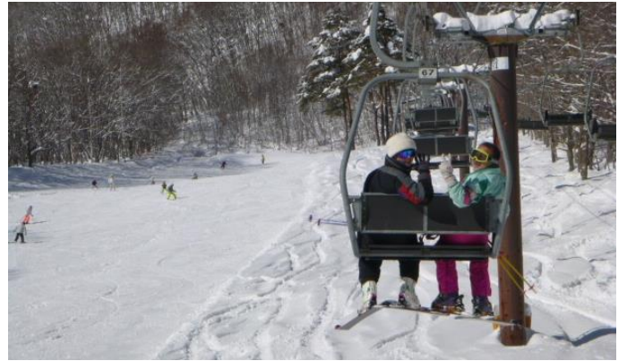
この気持ちよさは現地に行った者にしかわからない

日中の行動がそれぞれ別メニューばらばらの参加者も、夕食は全員一堂に会し、それぞれ楽しんだことに花が咲きました。特に釣りグループの成果でワカサギの天ぷらは大変美味でした。