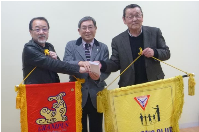
南山クラブとの合同開催でした。