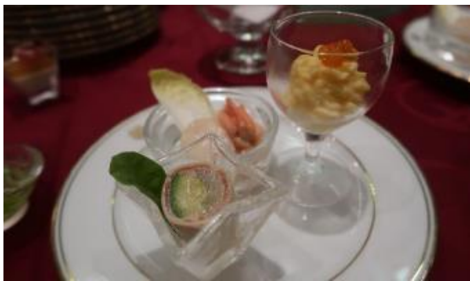
素晴らしい一品料理でした

前夜祭参加理由は、次期事業主任として次年度の活動が少しでも円滑に進められるよう、各部の要人・知人と懇親を図りたかったからです。目的達成！