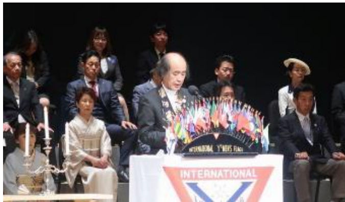
戸所理事の所信表明

例年とは毛色の違う大会になったことで、会場にいと、戸惑いや不平不満などチラホラ耳に入ってきましたが、賛否両論あるとしても、今回の大会の在り方は、今までの大会に何かしらの変化をもたらそうという問題提起であったように思います。そのようなことを考えると、「いつもの・・・」がない今回の西日本区大会は意義のある素晴らしい大会だったと思います。