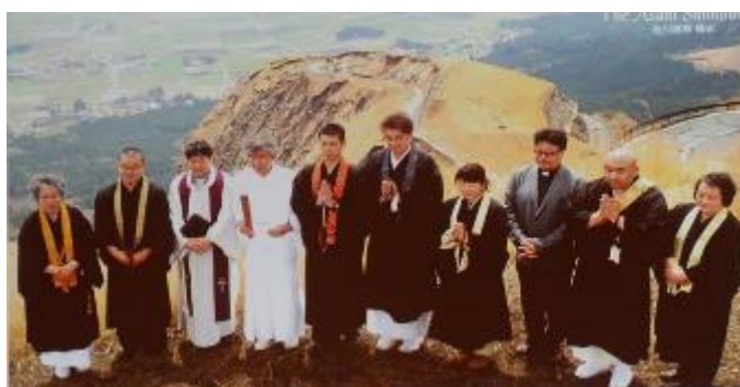
感銘を受けた宗派を超えた支援活動（早天礼拝にて）