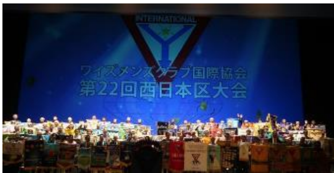
パナーセレモニー

会場へ到着すると、まずは大会受付へ。名札のみ受け取っただけで、何か足りない気が。そうだ！いつも印刷物で手渡される大会プログラムがないんだ！