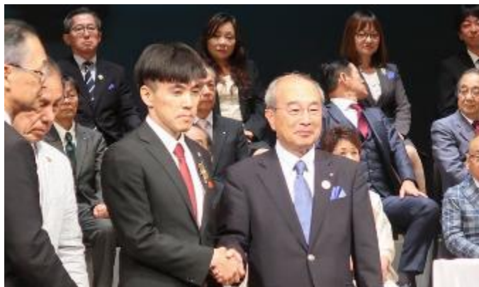
荒川Yサ・ユース事業主任就任式