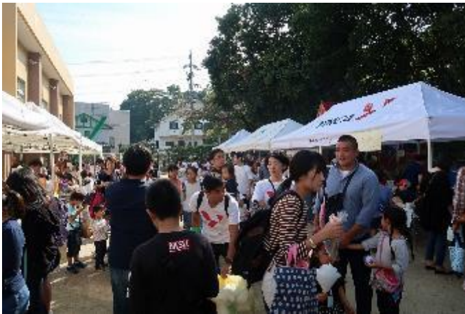
(秋空の元、恒例の南山バザーが開催されました)