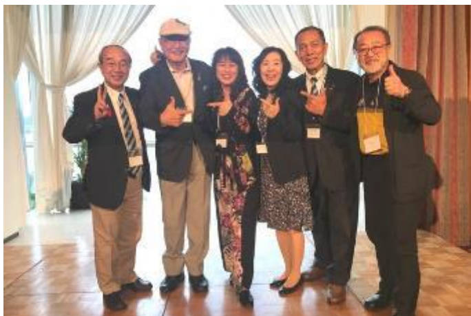
(名古屋より参加したワイズの皆さん)

広島クラブの皆さんとはロシアで一緒にいた仲間でもあり再会を喜び合いました。また時間の許す限り西日本区の役員の方々とも親しくなれとても有意義な1日でした。