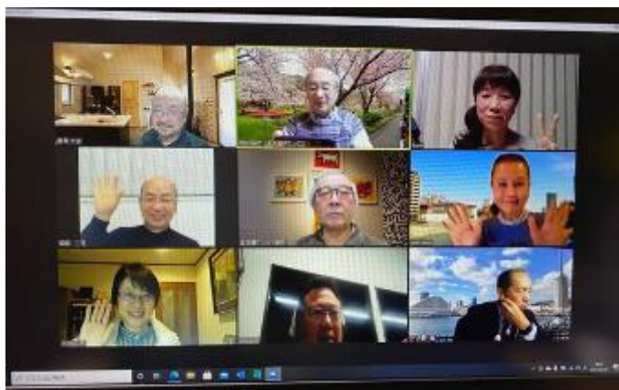
小グループでの交流会

中部から九州部まで143名（中部10名）の参加者が集い、第1部では各部長からの各部の状況報告と西日本区からの報告等、知りたかった情報を共有することができました。第2部では10人程度のグループに分かれてのフリートークで、久々に楽しく交流が図れたと思います。最初はフォーラムと言われて固いイメージが先行しましたが、自分のクラブ・部の情報を話し・聞いてみんなで共有する良い時間だったと思いました。押し付けられた時間ではなく創りあげた有益な時間でした。