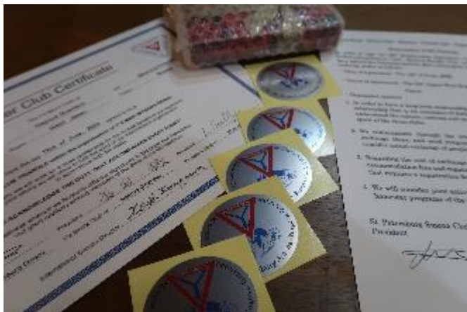
送付したIBC締結書、ステッカー