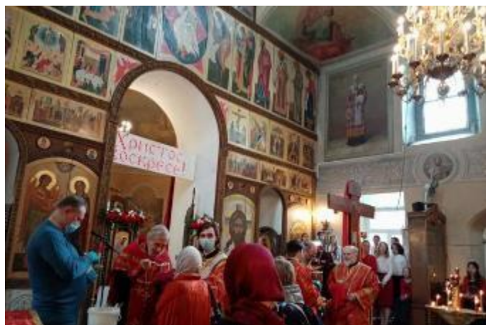
信仰心の厚いフレンズクラブがお祈りをする教会で2Fにミーティングルームがあります