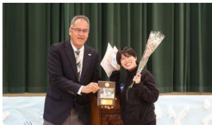
グランパスと関係深いコロコロリーダーも卒業です