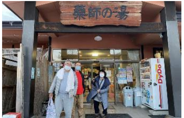
スキーしなくても必ず来る温泉です。(爺が岳)