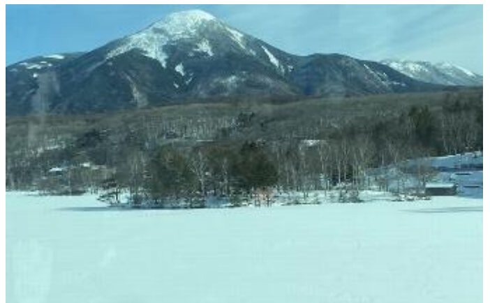
白樺湖は全面凍結していました(車山)