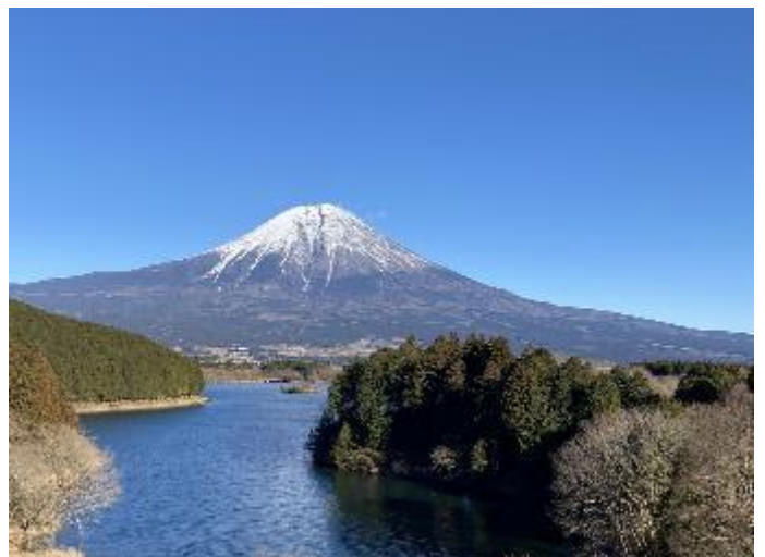
田貫湖からの富士山眺望です(個人旅行)