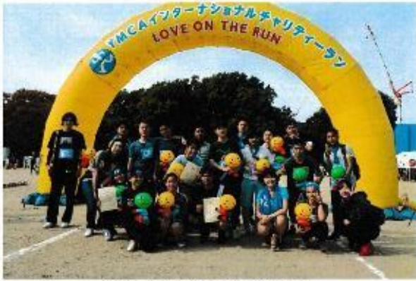
サポートありがとうございました。

ありがとうございます。この中からランニングの選手を、1人、選んで、サポートさせていただきます。