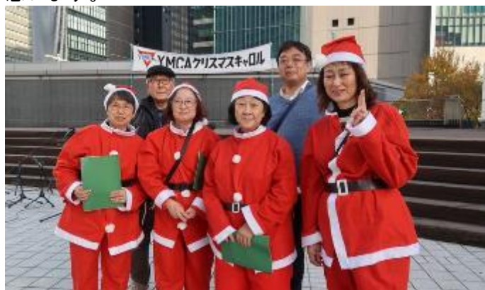
グランパス合唱隊

本番の日は異常気象と思われるぐらいの暖かさで機材を運ばば汗ばむ陽気でした。聖歌隊は約70名のサンタクロースとかわいいサンタの幼稚園児や小学生も加わり練習の成果を発揮していました。暖かい事もありギャラリーは多くの人で拍手も多く聖歌隊の参加者は励まされ練習以上の出来映えだったと思います。