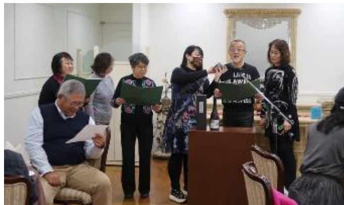
松原会長独演に助っ人参集

お食事大変美味しくこの店のオーナーは元YMCAメンバーでたいへんお世話になりました。