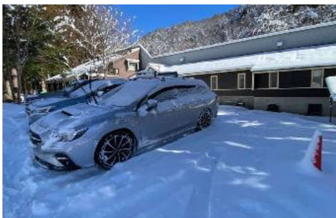
急に降った雪で車も埋まりました

マルハンロッジで気楽にくつろぎ、去年置き忘れたストックも持って帰りました。今回のスキーツアーもとても有意義でした。