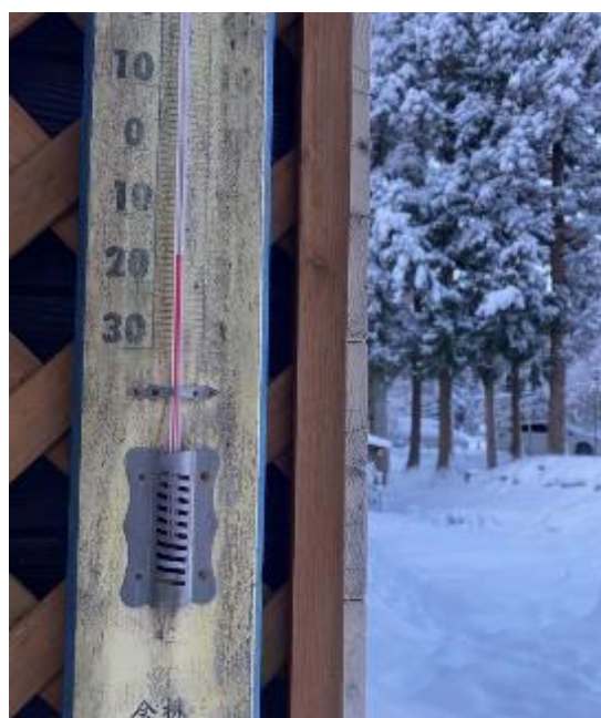
スキー場の朝は超寒いです。