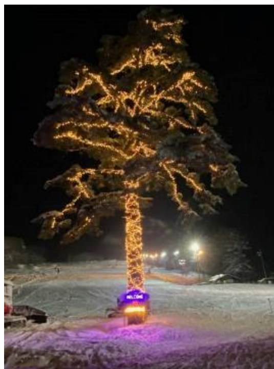
ナイターでの幻想的なLED演出