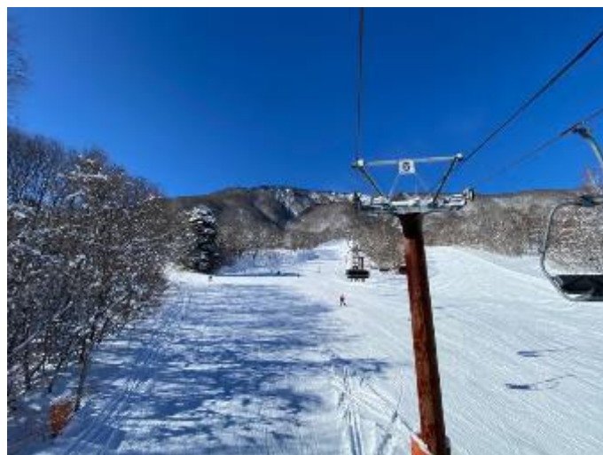
第三リフトから爺ヶ岳の絶景を楽しむ