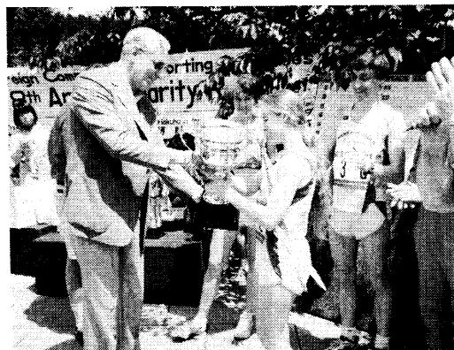
第一位はアイルランド銀行

の資金があり、今までの例では80%程度が収益金となるようです。収益金は障害を持つ青少年を対象に行われるY.M.C.A.のスポーツ、レクレーション、野外キャンプ等にあてられ毎年2000人近くの青少年がこの資金により