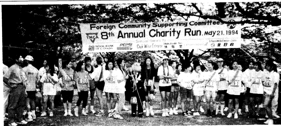
スタート(第一走者は女性)

12時のスタート前にチャックさんの司会で主催者あいさつ等のセレモニーに続きコスチュームコンテストが行われ“UFOやきそばん”のローレックスチームがダントツの一位で雰囲気大いに盛り上げていました。