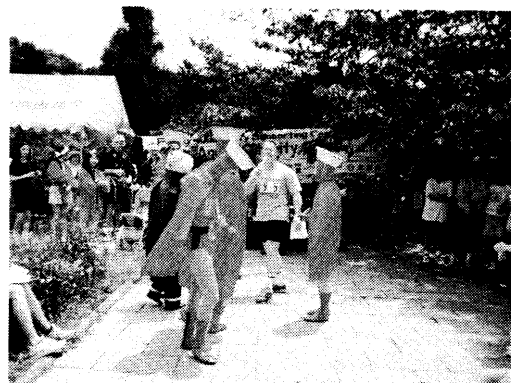
仮装コンクール 第1位

皇居の周りを2周するリレー方式で行われ1.5km区間が4区、2km区間が2区あり、6名で10kmを走ることになり、内2名は女性とすることが義務付けられています。