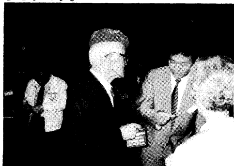
最年長 参加者94才大阪クラブ三井ワイズ御夫妻に三井兄ご挨拶

次にリフレッシュミュージックタイムでは視力障害、聴力障害の児童8名がハンドベル3曲を演奏、1曲を仕上げるのに1ヶ月もかかるそうです。