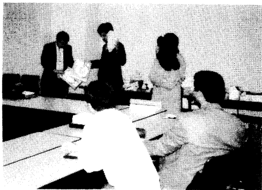
まずはよく値ぶみして...