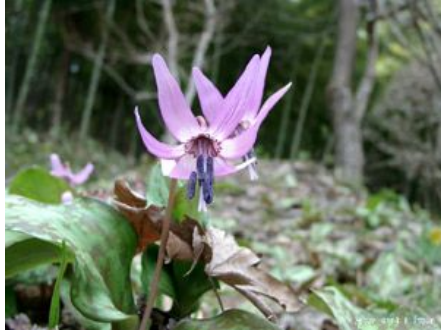
堅香子の花(かたくりの花)