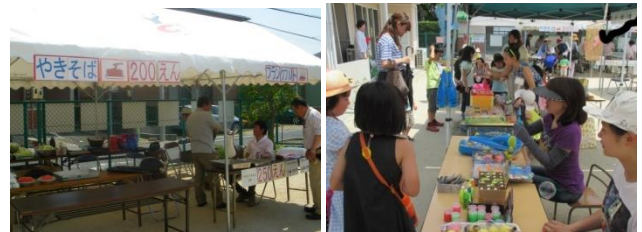
ワイズ焼きそばコーナー

日時 6月13日(土)～14日(日) 会場 ハイアットリージェンシー大阪 代議員会 10時15分～ 大会 13時15分～ 薦田会長出席の予定