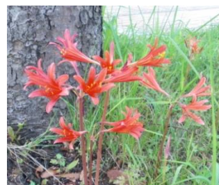
キツネのかみそり

健康維持のために5時頃より30分～40分コースをウォーキングしています。小鳥のさえずりが聞こえる小路を歩く時は小鳥の姿を追ってみたり幼鳥の声だなと思ったりしています。ウグイスが夏場よくないていました。セミの声もツクツクボウシにかわりヒグラシゼミのカナカナカナがきかれるようになりました。楽しみは道端の花壇に咲く花に逢えることです。コースによって出会う人が違いますが挨拶をし時に立ち話をすることもあります。90歳ちかいお年寄りが両手に鉄アレーをもって猫背の状態です。カメラを持ってのウォーキングのため途中休憩になってしまふときがあります。珍しい花を見かけましたので紹介します。