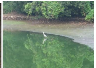
かわせみを見かける池