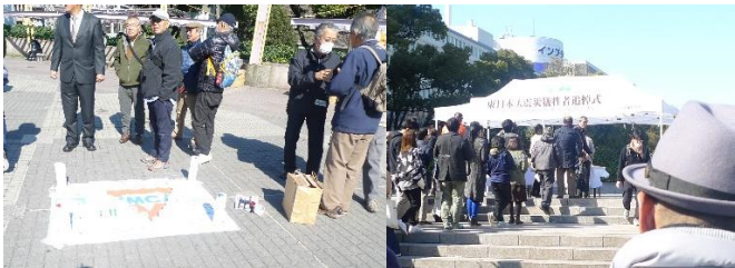
YMCAが用意したキャンドル

3月11日午後2時より名古屋栄・久屋公園で千人近い人が参加し2時46分には東北に向い黙禱をささげました。キャンドルもたくさん用意され点灯もしました。午後から風が強くなり会の関係者も苦労しておられました。