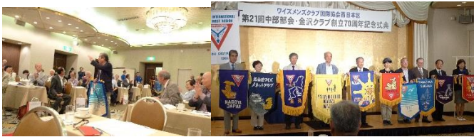
千賀会長バナー入場

台風の通過を心配していたが80キロのスピードで中部地区を通り抜け交通事情も平常通り運行されていたので無事に金沢へ向かうことができました。名鉄バスセンターでは名古屋地区のワイズが待っていて一緒にバスに乗りました。予約を同じ日にしたようで最前列から座席につくことになりました。