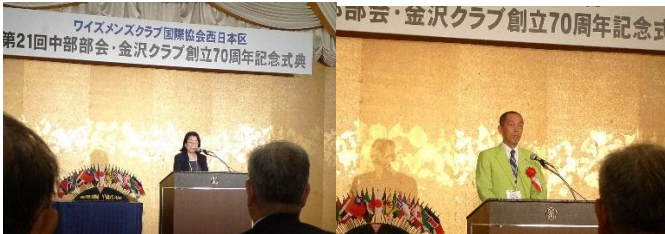
山内部長開会点鐘