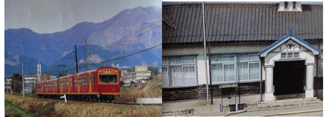
藤原岳を背に走る北勢線 木造校舎を改造の桐林館

阿下喜（北勢町） 三重県北端の北勢町は鈴鹿山脈と養老山地の内懐に抱かれた山の町 中心地の阿下喜は、滋賀県へと続く巡見街道、岐阜県への濃州街道が通る交通の要衝で、江戸期から商業が盛んな街です。三岐鉄道北勢線の終点・阿下喜駅から坂道を登れば “何でもそろそろ、商店街が現れる。桑名へ 20 キロ関ヶ原へ 20 キロ北勢町の阿下喜は二つの都市の中間にある。藤原岳の麓ののどかな町。