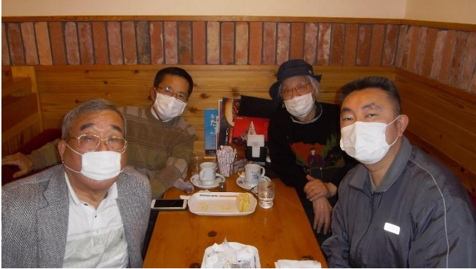
コロナの渦中でのショットです

日 時 2月14日 (日) 会 場 コメダ珈琲店亀山 全員集合の例会となりました 解散の手續きについて 確認