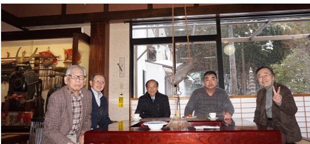
(12日、解散前にロビーにて)