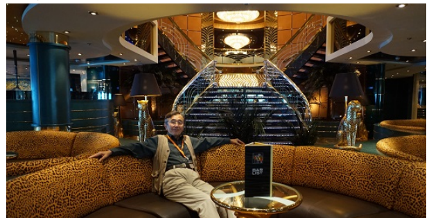
(MSCオーケストラのデッキ6にあるサバンナバーにて)

2015年8月22日現地時間19:00にドイツのキール港からクルーズ船“MSCオーケストラ”でスウェーデンのストックホルムに向かう船旅は、翌23日が終日航海だったので、二日ばかりで船内散歩、エアロビクス、デッキ6/7シアターショー鑑賞、朝焼け・夕焼け見物などを楽しみました。