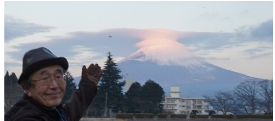
(5日早朝ウォーキング、東山湖から見た紅笠がけ富士)

翌朝6:30、「早朝ウォーキング」に参加。東山湖(ひがしやまこ)を反時計回りに散歩してから、キャンプ場で焚火にあたりながら富士山関係のクイズをしたり、シダケの先端に付けたマシュマロを焚火で炙って食べたり。その後、“夕陽の丘”に登って朝の富士山鑑賞。