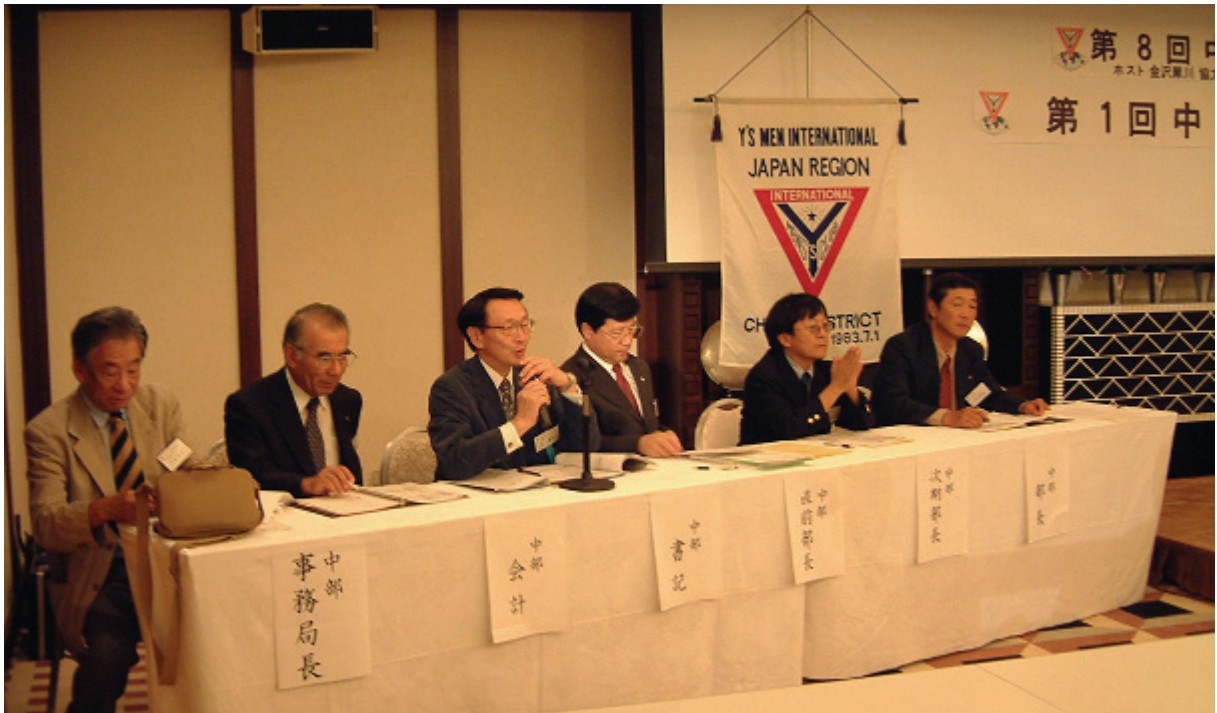
(第8回中部部会 2004年9月12日 ウェルシティー金沢)